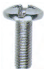
VI 09 L