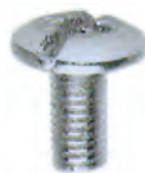
VI 09 C