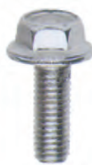
VI 07 L