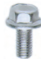
VI 07 C